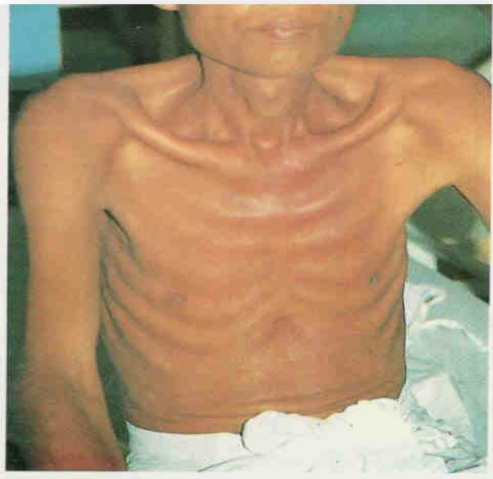
อาการผู้ป่วยผอมแห้ง

พยาธิตัวเมียในลำไส้ของคนจะออกไข่ ไข่จำนวนมากจะฟักเป็นตัวอ่อน และเจริญเป็นพยาธิตัวแก่ พยาธิตัวแก่ฝังตัวที่ผนังลำไส้เล็ก ทำให้สูญเสียหน้าที่ในการดูดซึมอาหาร เกิดอาการท้องเสีย อุจจาระมีกากอาหารที่ไม่ย่อย ท้องคลื่น โครกคราก ปวดท้อง บางรายถ่ายเหลวเรื้อรังนานนับเดือน ถ่ายวันละ 5-10 ครั้ง ท้องโตกดเจ็บ คลื่นไส้ อาเจียน เบื่ออาหาร ทำให้เกิดภาวะขาดสารอาหาร ผู้ป่วยจะผอมแห้ง ไม่มีแรง ภูมิคุ้มกันโรคลดลง และอาจรุนแรงถึงตายได้