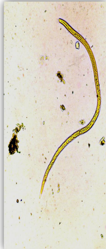
พยาธิตัวอ่อน